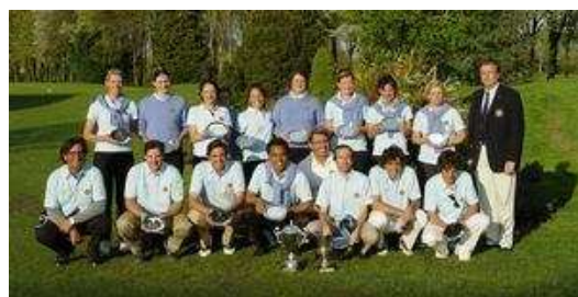
Les champions d'Alsace par équipes, sacrés dimanche dernier à La Wantzenau. (-)